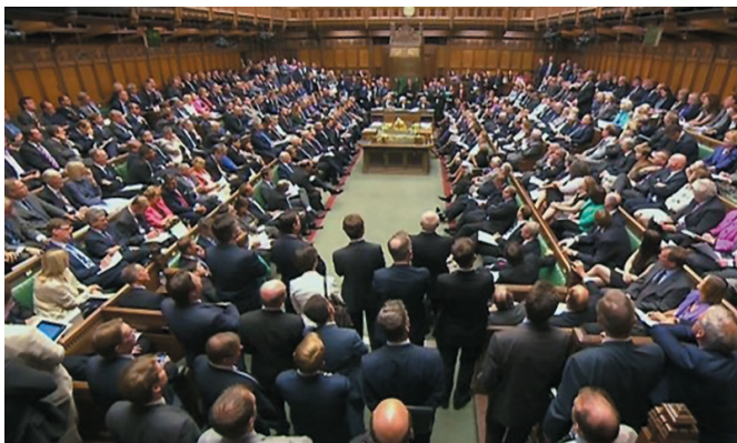
Засідання англійського парламенту в наші дні