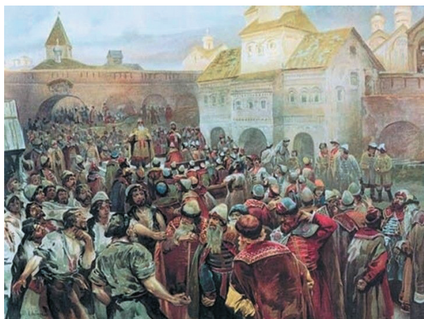
Народне віче часів Київської Русі