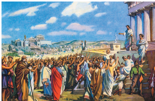
Народні збори в Афінах у V ст. до н. е.

Розгляньте подані зображення та, опираючись на знання, здобуті на уроках історії та правознавства, обговоріть у парах, що для вас означає демократія.