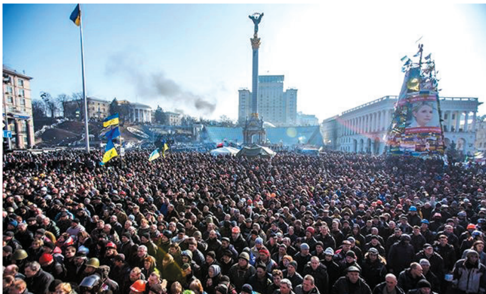
Віче на Майдані Незалежності в Києві, лютий, 2014 р.

■ Представницька демократія — це вираження волі громадян через обраних ними представників до органів державної влади — народних депутатів, президента, депутатів органів місцевого самоврядування.